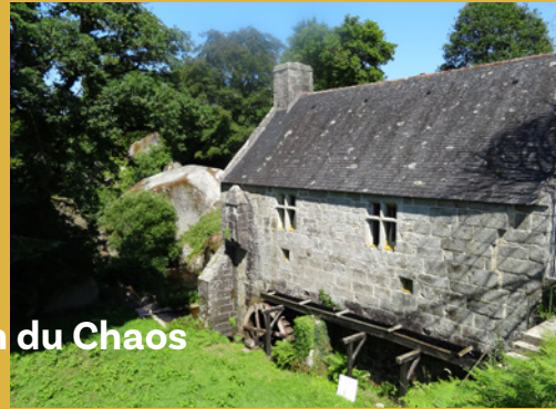
Moulin du Chaos

Cet ancien moulin seigneurial, construit en pierre de taille de granite au 16 e siècle, constitue une des portes d'entrée qui mène au site du Chaos. On y trouvait un logement et un espace réservé aux mécanismes du moulin. Au 18 e siècle, propriété de la société des mines de basse Bretagne, il est intégré au système hydraulique qui participe à l'exploitation des mines de plomb argentifère. Il est alors alimenté par le lac artificiel qui recueille les eaux de deux rivières dont celle du Fao qui forment, à partir du moulin, la rivière d'Argent, un affluent de l'Aulne.