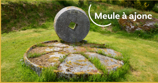
Meule à ajonc

Le hameau du Fao possède de nombreux logis dont les constructions s'étalent entre le 17 e et le 19 e siècle. Sur terrains privés, notez le très beau puits situé en face de la meule à ajonc. Cette plante, emblème de la Bretagne, avait de multiples utilisations : litière dans les étables, isolant de construction, combustible ou donné en fourrage aux chevaux et aux vaches. Dans ce dernier cas, il était broyé à l'aide de la meule pour en amoindrir ses piquants. Le mécanisme était actionné par un axe horizontal entraîné par un cheval.