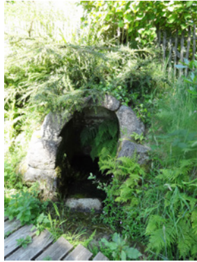
Fontaine-lavoir de Goashalec

Ici encore, un hameau de plusieurs siècles. La croix monolithe toute simple est probablement de la fin de l'époque médiévale. Sous l'Ancien Régime, de nombreux villageois y vivaient sous le régime de la « quévaise ». Le paysan, défri- cheur de terres souvent ingrates, jouissait ainsi d'une habitation et d'un lopin de terre. En échange, il travaillait gratuitement lors des jours de corvées et payait une rente au propriétaire (Abbaye cistercienne du Relec). La fontaine-lavoir située au centre du hameau de Goashalec (Berrien) a probablement été construite au 18 e siècle.