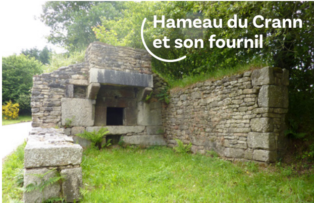
Hameau du Crann et son fournil

cheur de terres souvent ingrates, jouissait ainsi d'une habitation et d'un lopin de terre. En échange, il travaillait gratuitement lors des jours de corvées et payait une rente au propriétaire (Abbaye cistercienne du Relec). La fontaine-lavoir située au centre du hameau de Goashalec (Berrien) a probablement été construite au 18 e siècle.