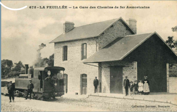
© Association « Sur les traces de François Juncœur »

Cette ligne des Chemins de Fer Armoricains, ouverte en 1912 et fermée en 1933, traversait le département du Finistère du nord au sud. Elle franchissait les Monts d'Arrée et passait par La Feuillée, l'une des plus importantes gares du secteur. Le train qui la parcourait était surnommé le « train patate » en raison des marchandises qu'il transportait et de son allure poussive.